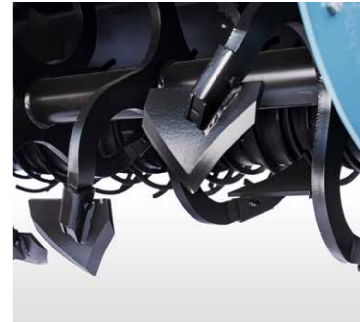
▲ Die Eco-Mix Spatenwelle

Der Culter ist ein separater Tiefenlockerer. Er kann auch allein oder in Kombination mit anderen Maschinen eingesetzt werden (siehe Broschüre des Imants Culter).