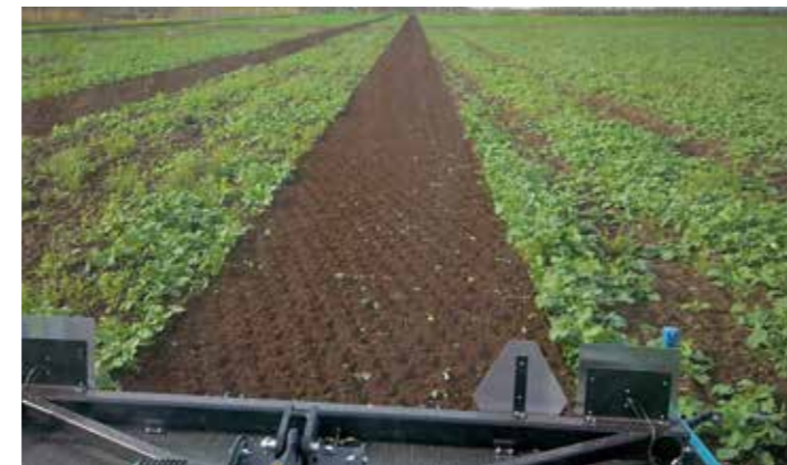
Keine störende Schicht