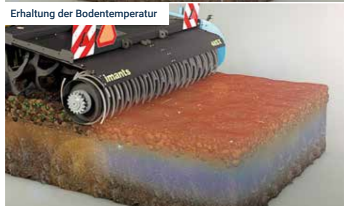
Erhaltung der Bodentemperatur