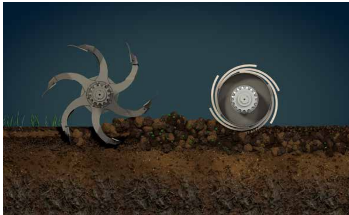
Bodenbearbeitung einer Spatenwelle mit Eggenwalze

Die Culter Eco-Mix-Kombination ermöglicht eine reduzierte Durchmischung UND eine tiefe Bodenbearbeitung. Die Spatenmaschine eignet sich für die „nicht-wendende Bodenbearbeitung“ (NWG).